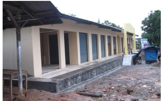
H50 16 Desember 2009