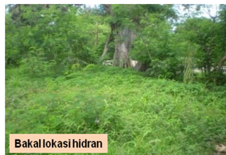
Bakal lokasi hidran