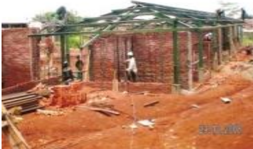
H30 23 November 2009