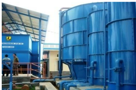
H75 Instalasi Air Minum IKK Bojonegara, Serang: 6°4'0.6"LS, 106°9'5.7"BT 27 Desember 2009